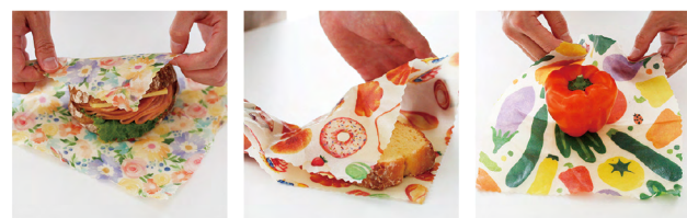
FLOWER SWEETS VEGETABLE

制電糸が編み込まれたマイクロファイバーで 拭き取るだけで 静電気の『パチッ』を防ぎます。