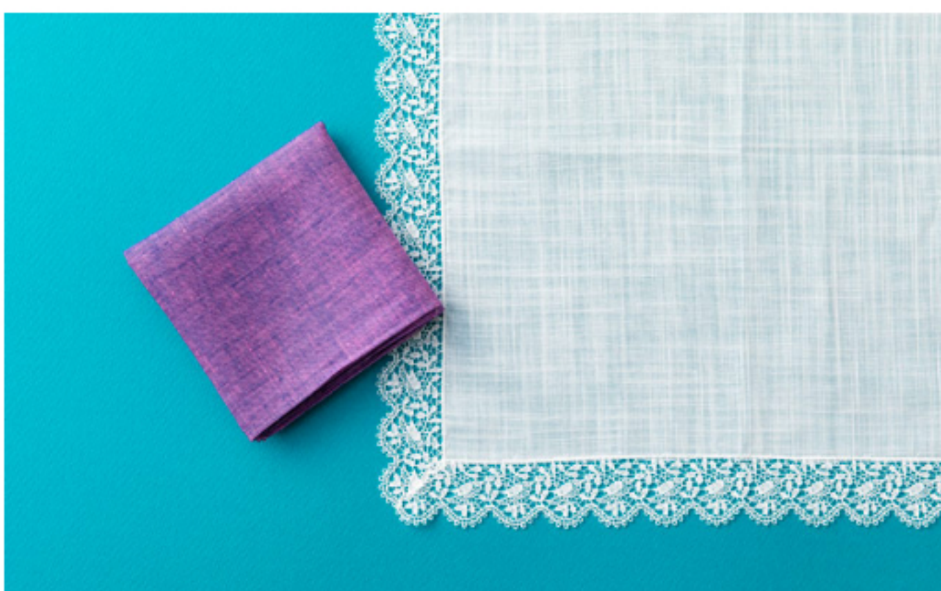
左/カラーリネン（3024円）、右/小鳥レース（3240円）

文明開化の先人として、1879年から当時まだ珍しかった洋傘や手袋、そしてハンカチーフなどの洋雑貨を取り扱い始めた「ブルーミング中西」。そんな歴史ある老舗店が、毎日の暮らしのなかで“ささやかだけど大切なもの”としてハンカチーフがお客様の心を輝かせることを使役として、ワンランク上のハンカチーフ専門店「クラシクス・ザ・スモールラグジュアリ」を2003年4月六本木ヒルズに1号店をオープン。2019年9月27日（金）には7号店として日本橋・コレド室町テラスに誕生する。厳選された良質な素材を、日本の優れた繊細で美しい織布技術と大胆で美しいグラフィックデザインを活かして、人々を魅了する逸品に仕上げている。